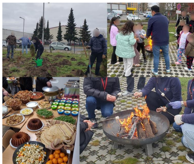
Gemeinsame Aktivitäten beim Gartentag in der GU Rauchstraße