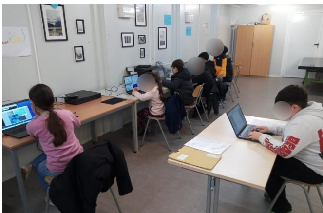
Computer-Kurs in der GU Am Oberhafen

Ein Projekt, das uns bereits im Jahr 2021 begleitet hat und von November 2023 bis November 2024 auch in der Gemeinschaftsunterkunft (GU) Am Oberhafen realisiert werden konnte, war die DELL-Förderung in Zusammenarbeit mit dem Deutschen Kinderhilfswerk. Hier konnten Kinder und Jugendliche aus der Unterkunft an Computer-Kursen teilnehmen. Es wurden wichtige digitale Kompetenzen vermittelt. Themen wie Cybersicherheit, Umgang mit Computern, Nutzung von Suchmaschinen und der verantwortungsvolle Umgang mit sozialen Medien wurden spielerisch umgesetzt.