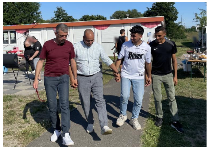
Kulturaustausch beim Begegnungsfest Am Oberhafen

Das Sommerfest Am Oberhafen war ein Highlight des Jahres. Bei strahlendem Sonnenschein trafen sich Bewohnerinnen und Bewohner, Nachbarschaft und Partner:innen zu einem fröhlichen und austauschreichem Fest. Aus rund 20 verschiedenen Ländern wurden vielfältige, köstliche Speisen angeboten, die das bunte, kulturelle Miteinander widerspiegeln. Für Unterhaltung sorgten sportliche Aktivitäten, die in Mitmach-Stationen organisiert waren und vom Kooperationspartner Sportkinder e.V. gestaltet wurden. Das Fest war nicht nur ein Genuss für die Sinne, sondern auch eine wertvolle Gelegenheit, die Zusammenarbeit zu stärken und die Gemeinschaft zu fördern. Unterstützt und gefördert wurde das Event durch das Bezirksamt Spandau.