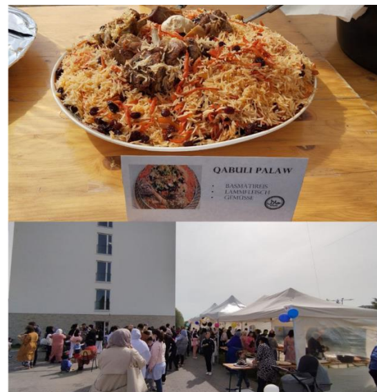
Impressionen vom Zuckerfest in der GU Rauchstraße

Gemeinsam mit der Nachbarschaft Hakenfelde hat das Team der Unterkunft Rauchstraße das Zuckerfest zum Ende des Ramadans gefeiert. Unsere BewohnerInnen haben mit köstlichen Speisen für ein kulinarisches Erlebnis gesorgt, während unser Kooperationspartner BENN Hakenfelde das Fest mit erfrischenden Getränken bereicherte. Ein schönes Beispiel für gelebte Nachbarschaft!