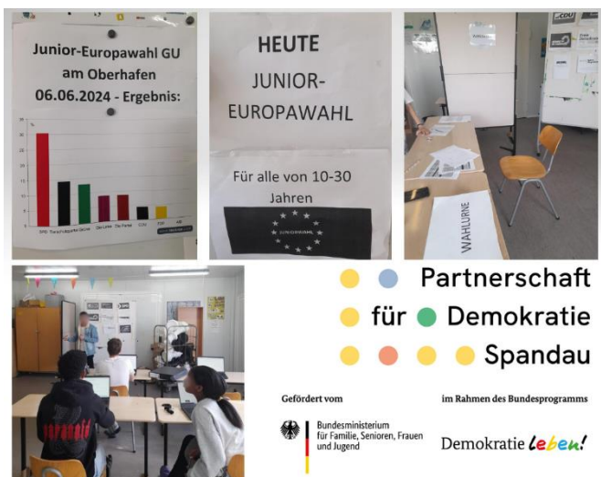
Junior-Europawahl in der GU Am Oberhafen

Abschließend fand ein weiteres Fest statt: das Gartenfest in der Rauchstraße. Ein besonderes Highlight war die Unterstützung durch unseren Kooperationspartner Tiny Forest Berlin, die einen Nanowald im Garten der Unterkunft errichtet haben – ein Schritt, der nicht nur die Natur bereichert, sondern auch den Gemeinschaftsgeist stärkt. Unsere Teilnehmer:innen nutzten die Gelegenheit, die Hochbeete mit Blumensamen und Zwiebeln zu bestücken, und auch die Kinder des Hauses halfen nachmittags tatkräftig mit. Was wäre ein solches Event ohne eine gemütliche Atmosphäre? An der Feuerschale wurden Marshmallows geröstet, während Kinderpunsch, Tee und Kaffee für wärmende Gespräche sorgten. Das Mittagsbuffet bot ein leckeres internationales Angebot, von Pizza über Linsensuppe bis hin zu Reis mit Fleisch und arabischem Salat – ein kulinarischer Genuss, der die Vielfalt unseres Hauses kennzeichnet. Dieses Fest war eine willkommene Möglichkeit, den Herbst ausklingen zu lassen und die Winter- und Weihnachtszeit einzuleiten. Unterstützt und gefördert wurde das Projekt durch den Integrationsfond vom Bezirksamte Spandau.