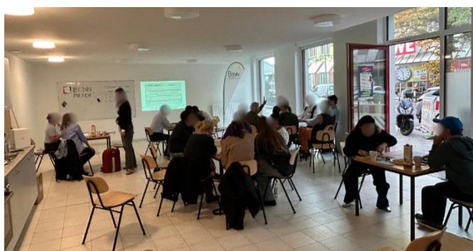
Einblicke von der Eröffnungsveranstaltung

In den Räumlichkeiten der Gemeinschaftsunterkunft Quedlinburger entsteht das erste Projekt mit BENN Mierendorffinsel: WERK_RAUM. Für zukünftige Workshops sind alle eingeladen, die handwerkliches Geschick mitbringen und Interesse haben, etwas anzubieten. Wir freuen uns auf weitere kreative Aktionen und einen regen Austausch!