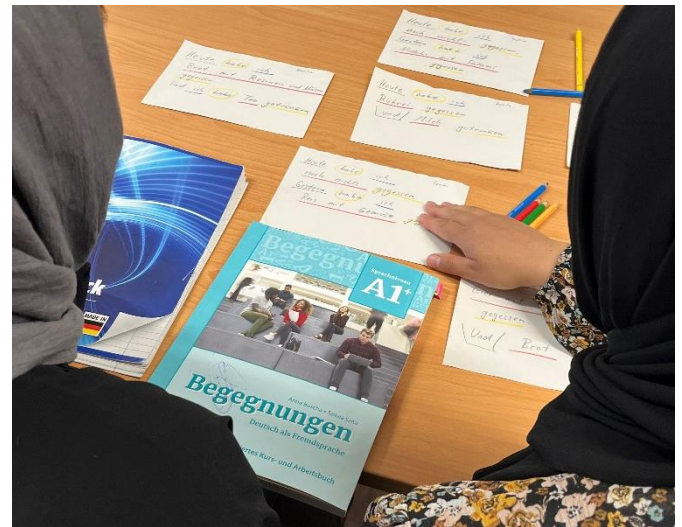
Gemeinsames Lernen in der GU Rauchstraße