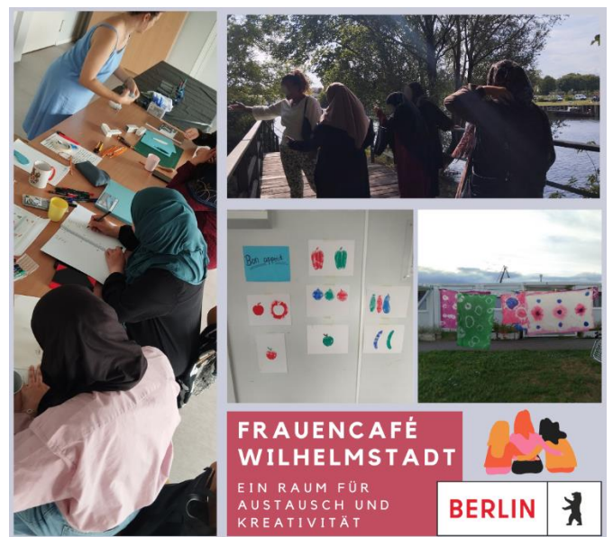
Workshops und Aktivitäten im Rahmen des „Frauencafés“

Das Frauencafé Am Oberhafen war ein weiteres erfolgreiches Projekt, das kreative und informative Workshops für die Frauen aus der Gemeinschaftsunterkunft Am Oberhafen anbot. Es war auch für Frauen aus der Nachbarschaft geöffnet, was den Austausch und das gegenseitige Kennenlernen förderten. Die Teilnehmerinnen waren besonders stolz auf die künstlerischen Werke, die sie in verschiedenen Workshops wie dem Nähkurs, Batik-Workshop und Farbdruck-Workshop schufen. Diese Treffen boten nicht nur Raum für kreativen Ausdruck, sondern auch für den Aufbau von Gemeinschaft und gegenseitiger Unterstützung, sowohl innerhalb als auch außerhalb der Unterkunft.