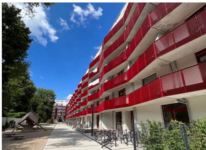
Außengelände der GU Quedlinburger Straße

Neben den vielen Projekten haben wir im August 2024 den Betrieb der Gemeinschaftsunterkunft an der Quedlinburger Straße übernommen. Wir heißen unsere neuen Kolleginnen und Kollegen herzlich willkommen und freuen uns auf eine erfolgreiche Zusammenarbeit. Die Quedlinburger Straße bietet Platz für bis zu 550 Bewohnerinnen und Bewohner und wurde im März 2024 fertiggestellt. Diese Erweiterung wird dazu beitragen, noch mehr Menschen ein Zuhause zu bieten und den integrativen Prozess in unserer Region weiter zu fördern.