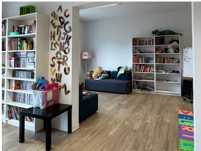
Lese-, Lern- und Spielumgebung für Alle in der GU Rauchstraße