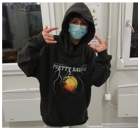
Die Hoodies kommen super bei den Kindern an.